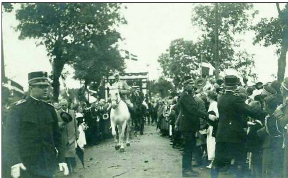
Fig.1. Postkort. Kongen er netop reddet over "Kongeågrænsen" ved Frederikshøj den 10. juli 1920. Der er tusindvis af sønderjyder på vejen og inde på markerne, og politiet sørger for at skabe plads til kongen, prinserne og landaueren med dronningen og prinsesserne.